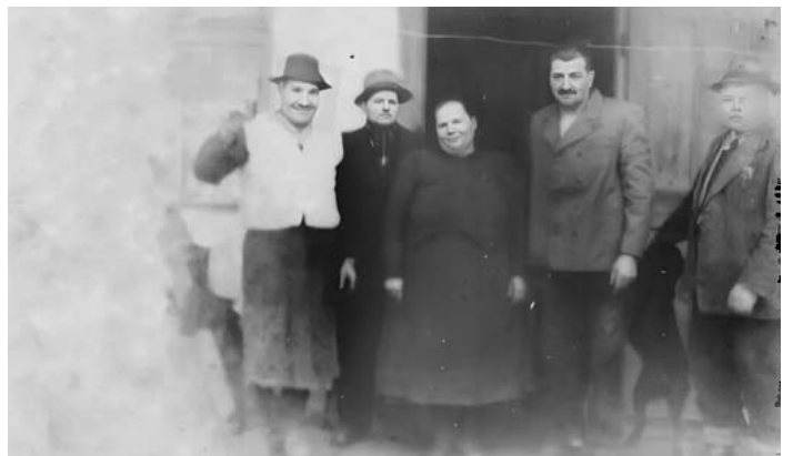
1918. május 1.

Emlékképek Tolmács múltjából - Olvasóink gyűjteményéből