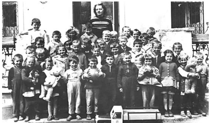
Óvodai csoportkép a '60-as évből