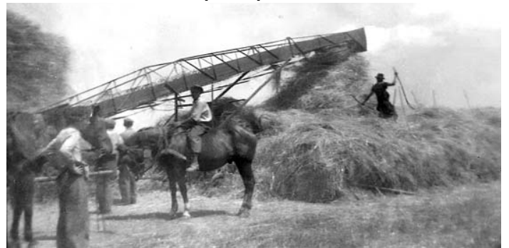
Aratás után cséplés cséplőgéppel