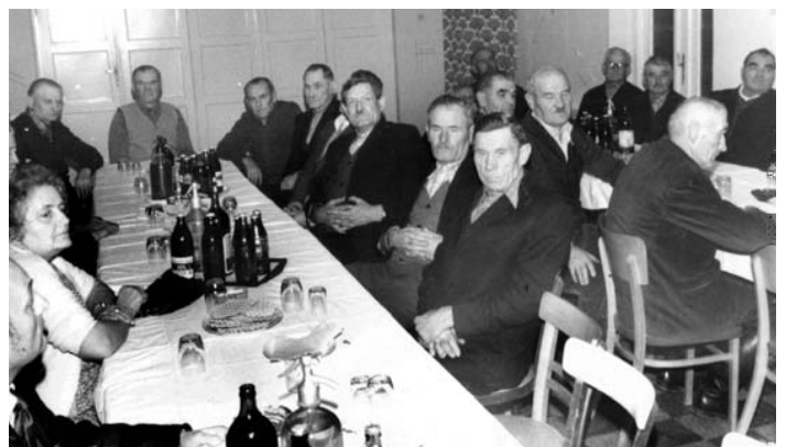
Régi tolmácsi emlékek