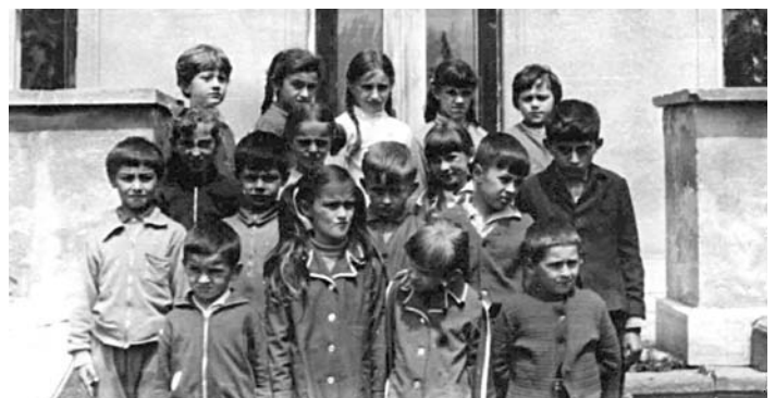
Régi tolmácsi emlékek