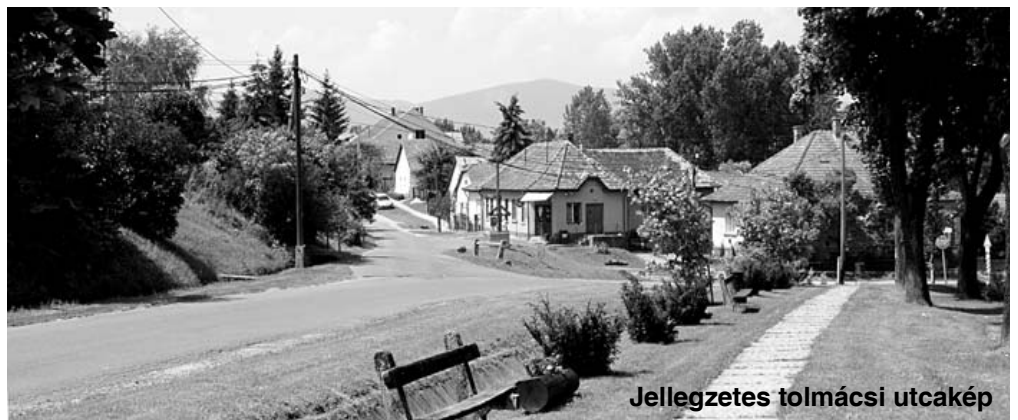
Jellegzetes tolmácsi utcakép

Amikor a családi fotoalbum lapozgatása közben olyan régi fénykép akad a kezébe, amely Tolmács múlt-jához is kapcsolódik, kérjük, hogy az utókornak megőrzés céljából hozza be a Községi Házba. A képet digitalizáljuk és visszaadjuk. Így gazdagíthatjuk közös értékeink tárárt.