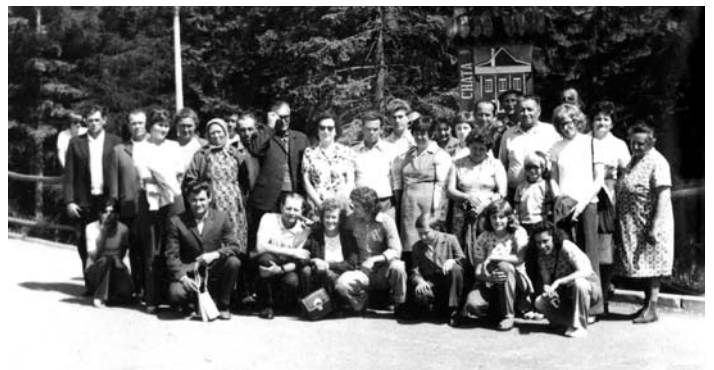
Régi tolmácsi emlékek