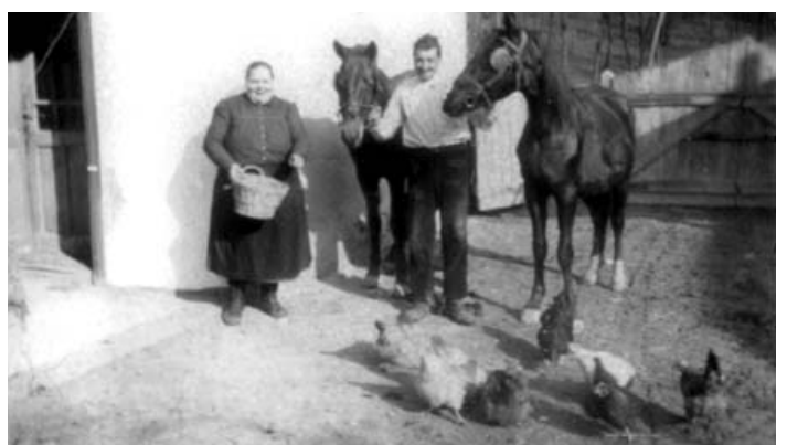
Régi tolmácsi emlékek