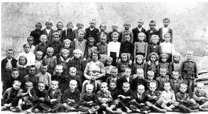
Régi tolmácsi emlékek