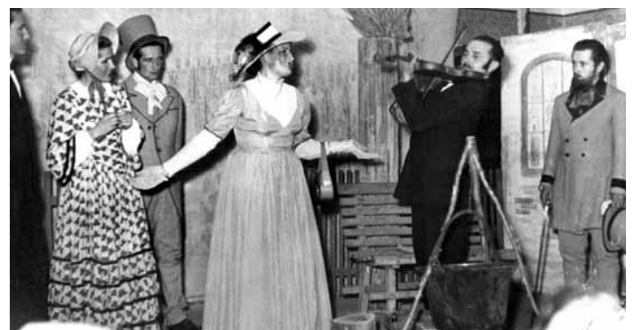
Dankó Pista című előadás Tolmácson 1957-ben