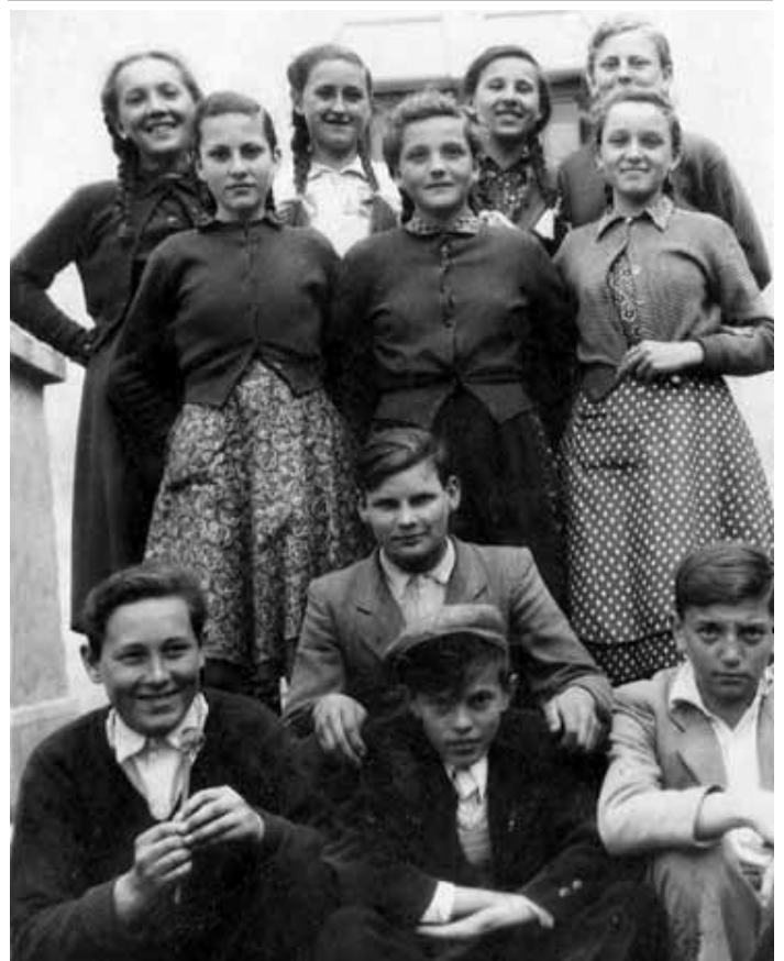
Tolmácsi iskola egykori 8. osztályosai