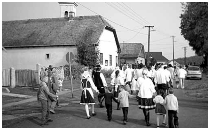
Képek Tolmács múltjából