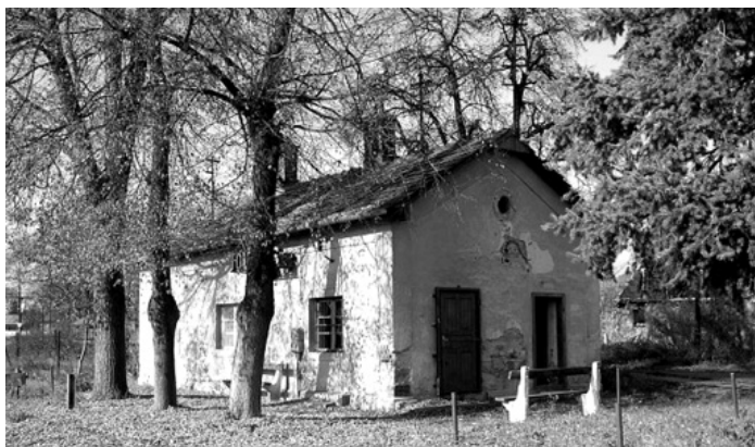
Képek Tolmács múltjából