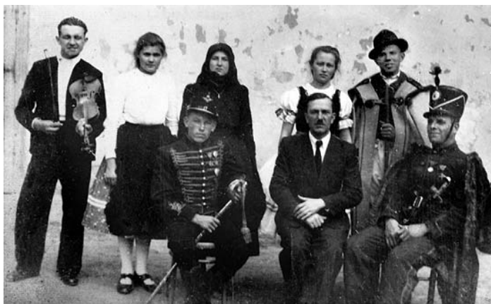
Képek Tolmács múltjából