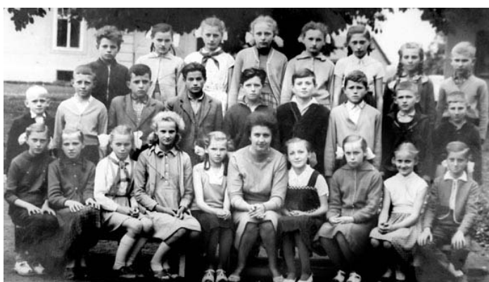
Fotók Tolmács 50 éves iskolájának múltjából