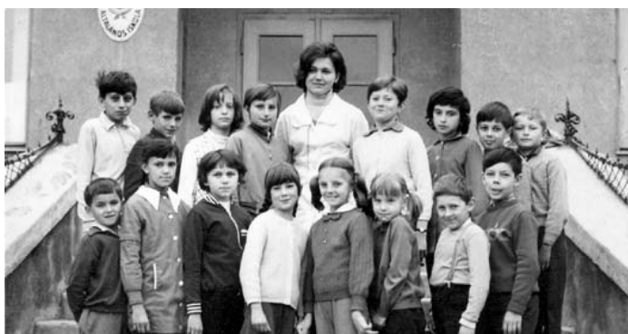
Fotók Tolmács múltjából