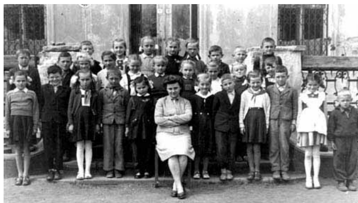
Két újabb fotó Tolmács múltjából