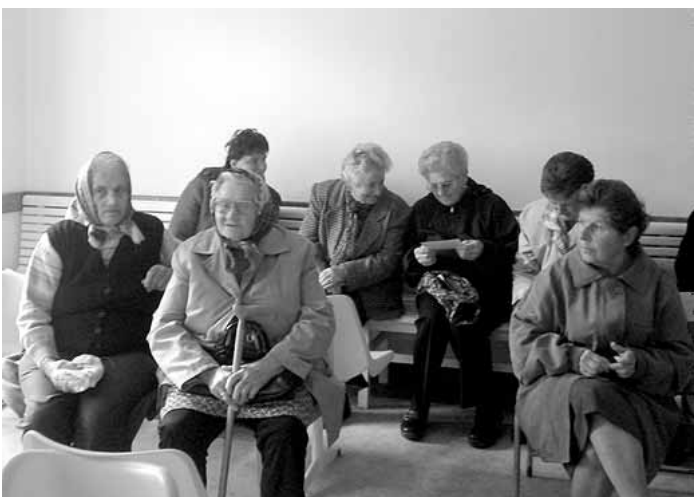
Képek az akadálymentesített orvosi rendelő átadásáról