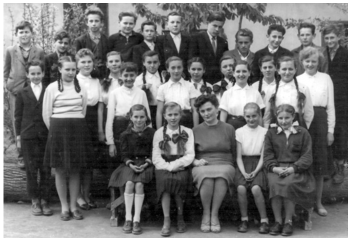
Régi tolmácsi képek