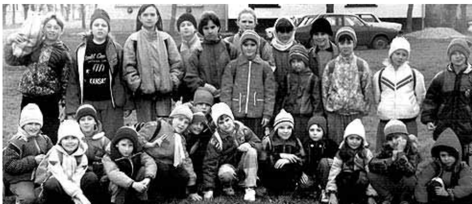
Iskolánk tanulói a kilencvenes években.